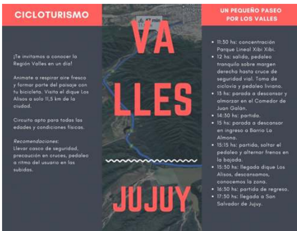
Figura N°3. Modelo de folleto. Elaboración propia.