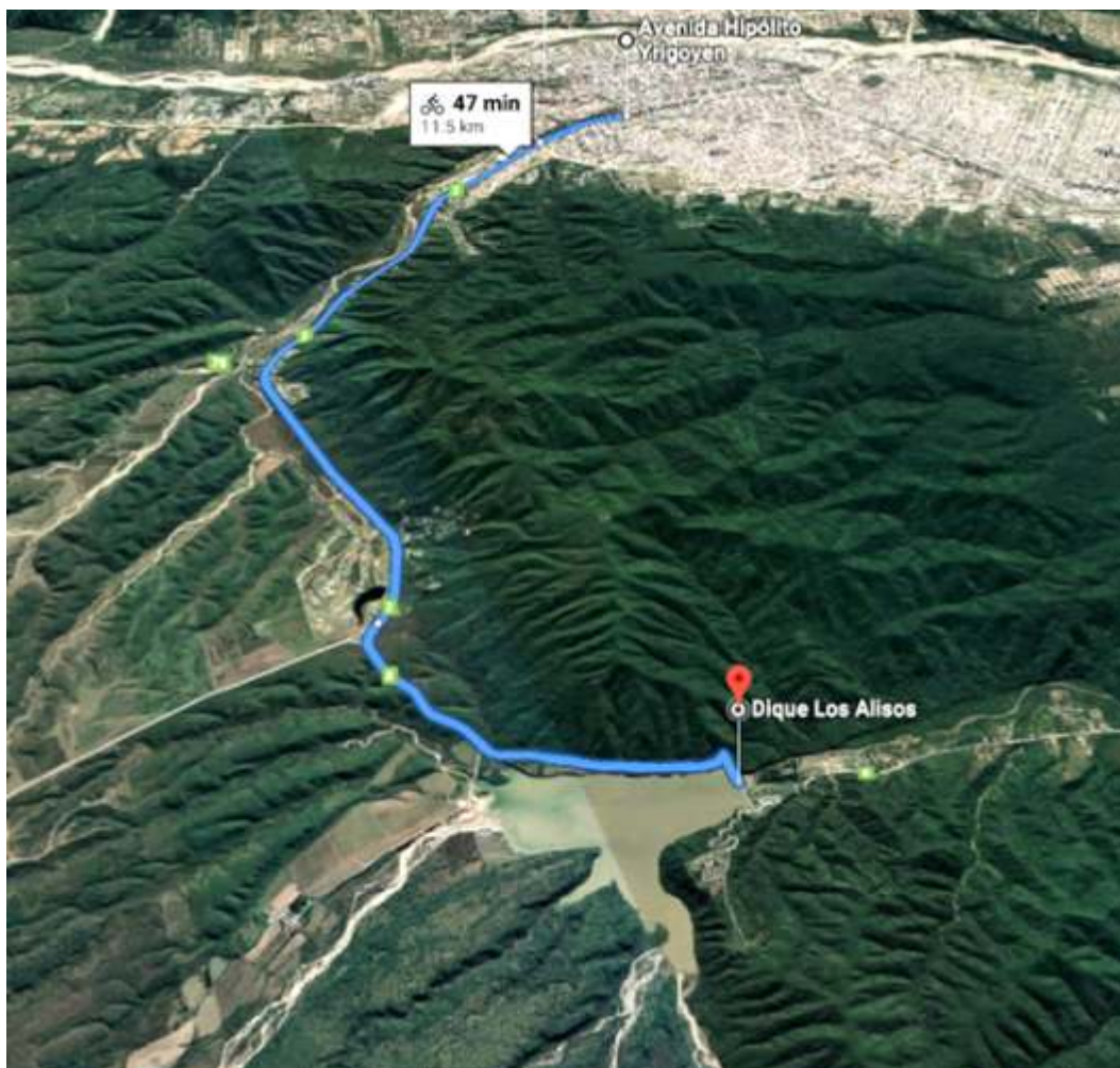
Figura N°1. Vista satelital del circuito. Adaptado de Google Maps.

Fue diseñado para que cualquier persona pueda realizarlo, apto tanto para principiantes o como para expertos, sin restricciones de edad y con flexibilidad para su práctica, cada persona lo realizará de acuerdo a sus capacidades, sin exigencias de tiempos. El circuito se creó con la idea de que pueda servir de modelo para realizar con esta base, un producto turístico de alquiler de bicicletas con visitas guiadas, o un proyecto de establecimiento de bicicletas por parte del sector público para el uso tanto de residentes como de turistas, etc.